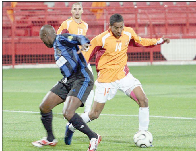
جدو في مباراة أم صلال والسيلية

وسيكون على مدرب أم صلال التعامل مع الواقع الميدانية كما هي في غياب لاعبين محوريين سواء